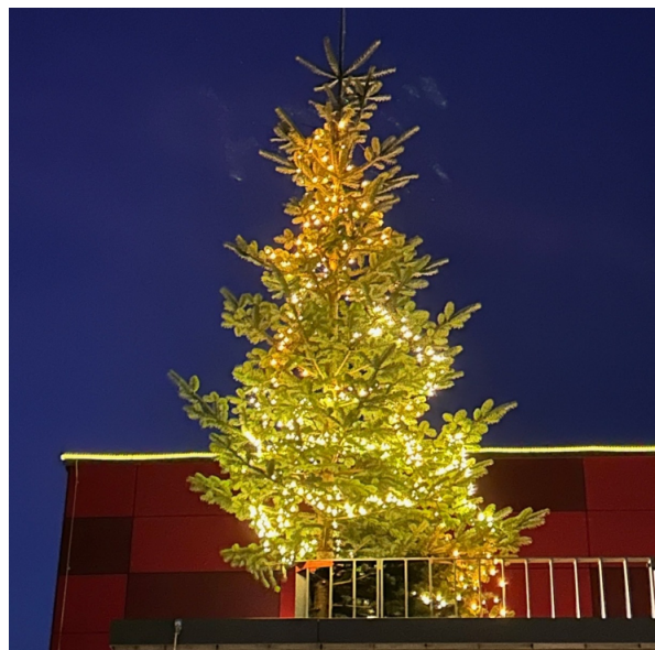
Weihnachtsbaum am Feuerwehrhaus

Am letzten November-Wochenende gab es noch ein Ausbildungs-Highlight für unsere Maschinisten: Am Freitag und Samstag wurden sie in den Themen "Anschlagen von Lasten" und "Mechanische Zugeinrichtung" (Seilwinde) geschult. Vielen Dank an Heavy Rescue Germany für die sehr lehrreiche Fortbildung. Nach einer umfangreichen theoretischen Einweisung ging es in die Praxis. An zahlreichen Übungs-Stationen wurde die Nutzung der mechanischen Zugeinrichtung unseres neuen Löschfahrzeugs geübt. Schwerpunkte waren das Anschlagen von Objekten, die Nutzung vom direkten Zug, mit fester Rolle (Umlenkung) und mit loser Rolle (Kraft-Verdopplung).