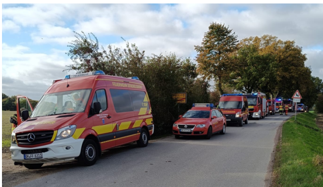
Übung der 9. Feuerwehrebereitschaft in Wangels

Der Oktober stand ganz im Zeichen von Ausbildung. Anfang Oktober trainierten wir erst das Vorgehen im Gerätehaus bei einem Stromausfall und Mitte Oktober nahm unser Einsatzleitwagen an einer Ausbildung der 9. Feuerwehr-Bereitschaft teil. Ende Oktober bewältigen wir drei Einsätze innerhalb weniger Tage (1x Türöffnung, 2 x Brandmeldeanlage).