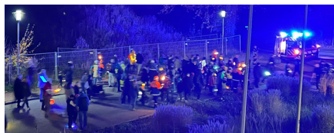
Laternen-Umzug am 08.11.2025

Deutschen Roten Kreuz Stockelsdorf für die tolle Unterstützung. Herzlichen Dank auch unseren Sponsoren, die erst die Durchführung dieser Veranstaltung möglich gemacht haben: Moin Fahrschule, Markisenhof Lübeck, Först Media und Pasdzierny Kfz.-Meisterbetrieb GmbH. So konnten wir auch eine Gewinn-Aktion durchführen. Herzlichen Glückwunsch an unsere 2 Gewinner bei der „2-Meter-Challenge“ (in den Kategorien Kinder und Erwachsene).