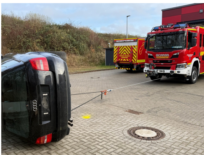
Ausbildung mit der mechanischen Zugeinrichtung